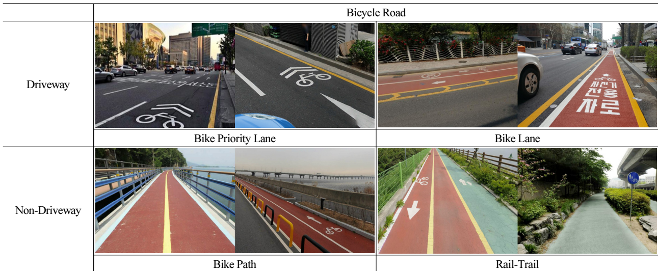
Fig. 1. 4 Types of Bicycle Road