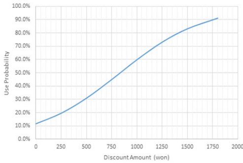
Fig. 1. Use Probability According to Discount Amount